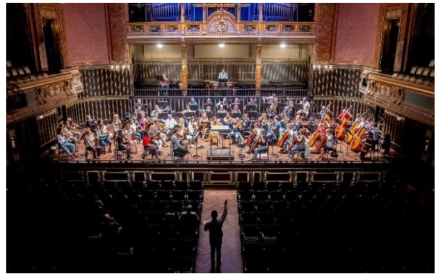
A MÁV Szimfonikus Zenekar koncertje a Zeneakadémián a kezdeti időkben és 2025-ben