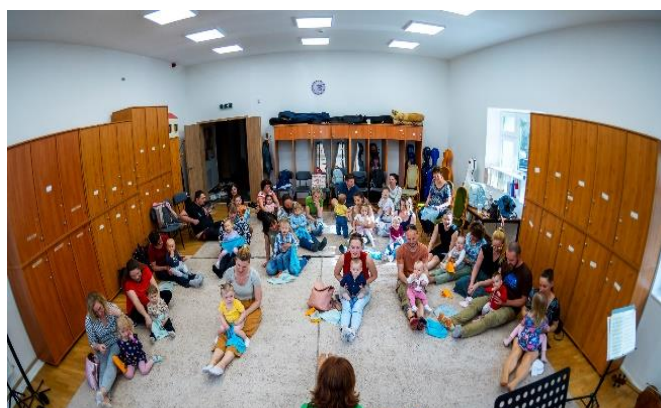
Búgócsiga foglalkozás a MÁV Szimfonikusok székházában

Számos programunkkal és kezdeményezésünkkel egy rozsaövezetben álló, funkcióját vesztett épületbe pezsgő zenei és kulturális élet költözhet végre, biztosítva annak lehetőségét, hogy jelentős kulturális értékteremtés, valamint ismeretterjesztés és oktatás helyszíne legyen az ingatlan. tervünk, hogy a Zenekar székháza Ferencváros (egyik) kulturális központja legyen.